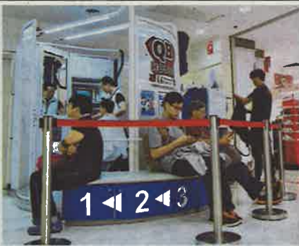
直径約2mのシェル型店舗でエレベーターホールにも出店(写真上)、幅1.4mの極小店舗もある—ともに香港のQBハウス

小売りや外食以上にアジアでのチェーン展開が難しいサービス業で、日本のノウハウを生かして事業を軌道に乗せる企業が現れ始めた。10分千円のヘアカット専門店「QBハウス」を運営するキュービーネット(東京・渋谷)は香港で48店まで増やし現地最大手に成長した。どの店も均一のサービスと料金で安心できるのがチェーンの強みで、伝統的な個人業者から顧客を奪いつつある。