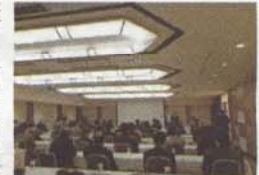
日本アセアンクリーニング連合会発足式

具体的には①日本のCL業者のアセアン進出支援②日本のCL業者とアセアン企業のマッチング(資本提携含む)③日本の業者へのアセアン情報提供④日本、アセアン各国の人材交流及び紹介・斡旋・研修支援である。